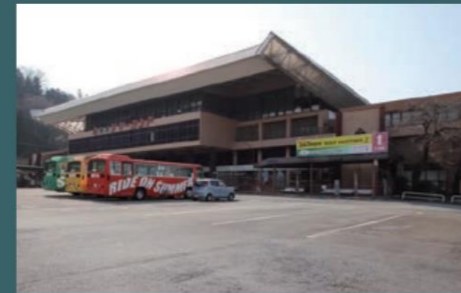
◎東京サマーランド