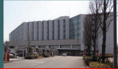
◎公立阿伎留医療センター