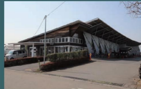
◎秋川ファーマーズセンター