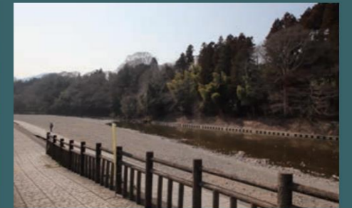
◎秋川橋河川公園 バーベキューランド