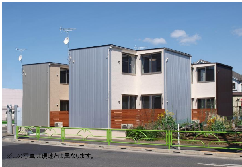
※この写真は現地とは異なります。